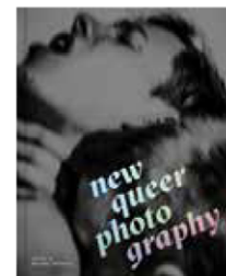
New Queer Photography, Benjamin Wolbergs

Kettler Verlag, Dortmund www.verlag-kettler.de Hardcover, 304 Seiten, Text in Englisch ISBN 978-3-86206-789-3 58,- €